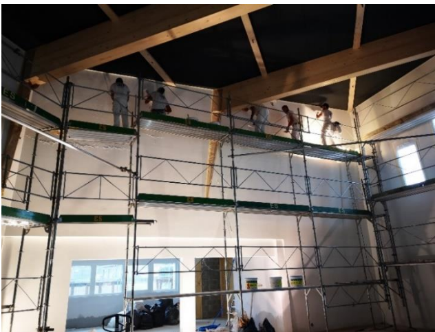
Crépissage de la salle de culte