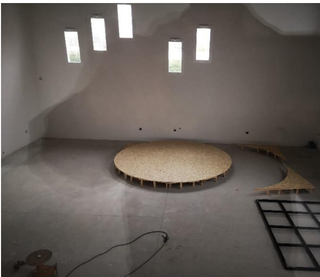
La scène en construction